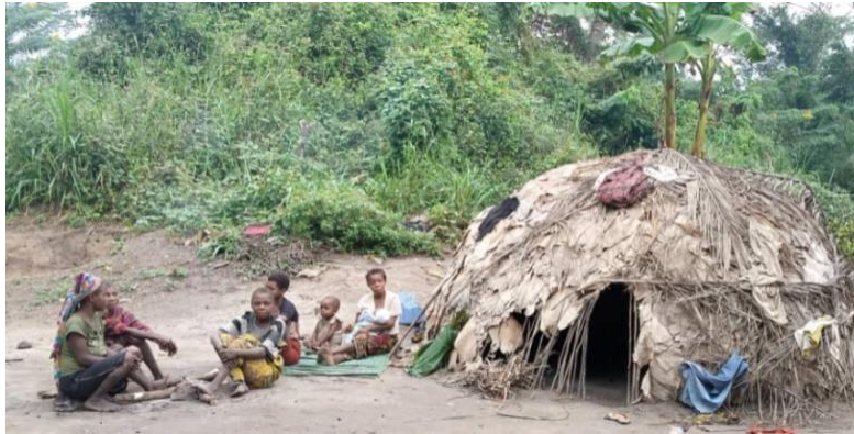
Figure 2 Pygmées de Mongoumba (Centrafrique)