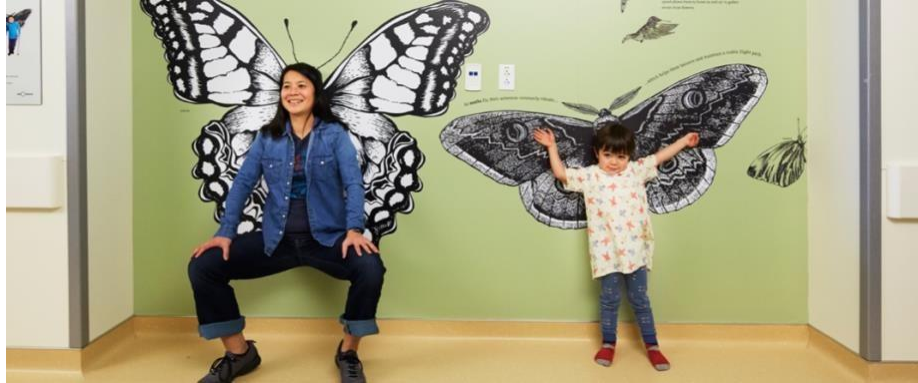
Figure 5 Un exemple d'aménagement de type biophilic design destiné aux enfants