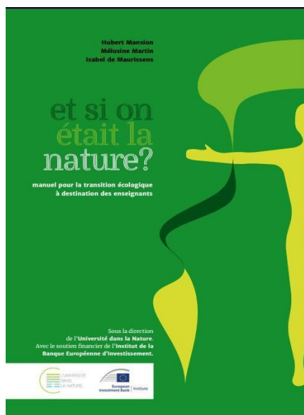
Figure 3 Couverture du manuel Et si on était la nature ?