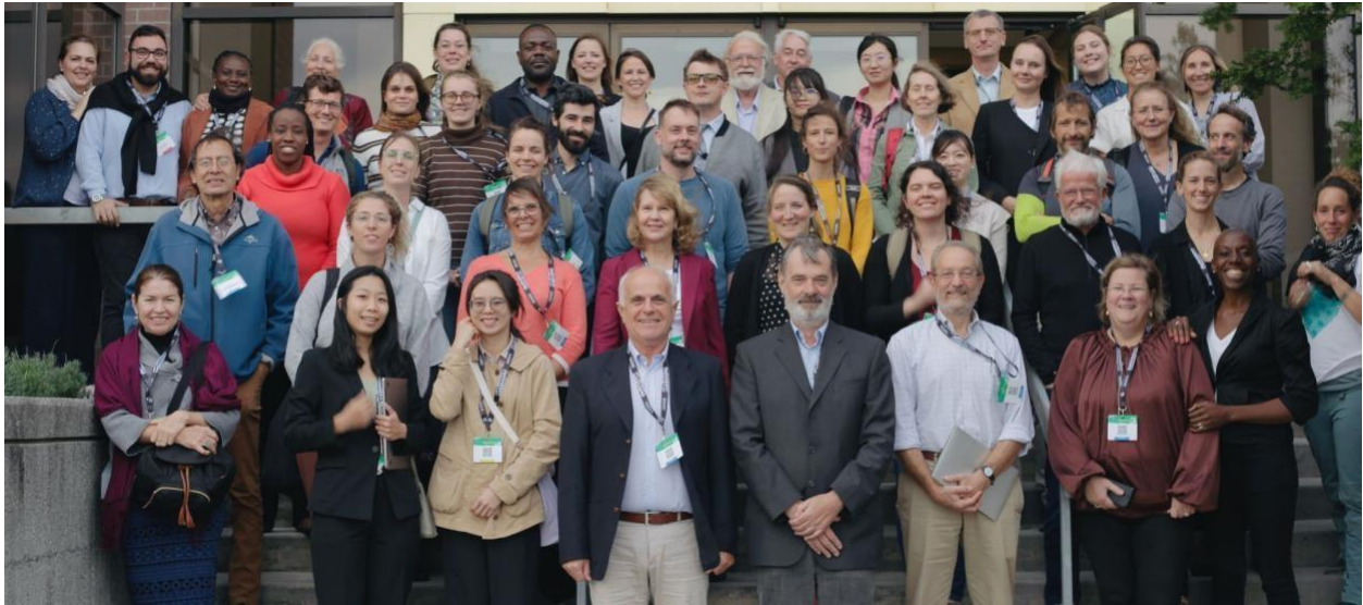
Figure 1 Photo finale du World Conference on Forests for Public Health

L'année 2023 a été marquée par la troisième édition du World Conference on Forests for Public Health que nous avons accueilli avec la Faculté de médecine de l'Université de Sherbrooke. Des scientifiques à la pointe de la recherche de plus de 25 pays se sont réunis pour présenter leurs dernières publications. La prochaine édition du Congrès sera également accueillie par l'Université dans la Nature - Europe et se tiendra dans la ville de Luxembourg en mai 2025.